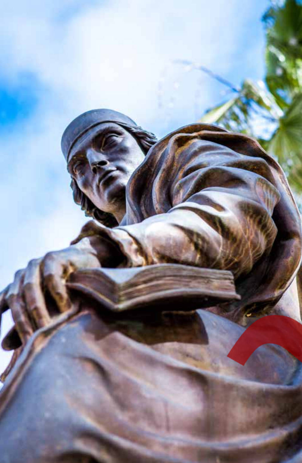
◀ El emblemático monumento a Nebrija en la Plaza de España de su ciudad natal. Una obra del escultor sevillano José Lafita. / José M a Benítez Sánchez.

España al Nuevo Orbe. 11. Historia de los manuscritos y de las ediciones nebrisenses: el importante papel de las imprentas de su familia en Granada y Antequera. 12. La recepción de la obra del humanista andaluz desde el siglo XV hasta la actualidad.